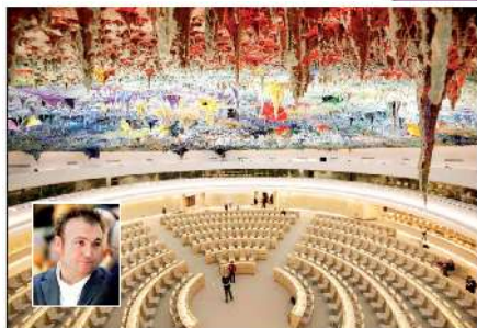
Imagen de la nueva sala del Consejo de Derechos Humanos de la ONU en Ginebra. Costó cerca de 20 millones de euros y fue financiada con ayuda para el desarrollo de España