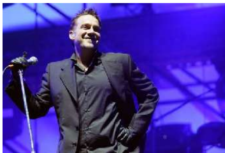
Vicentico, vocalista de los Fabulosos Cadillacs en su gira de regreso.